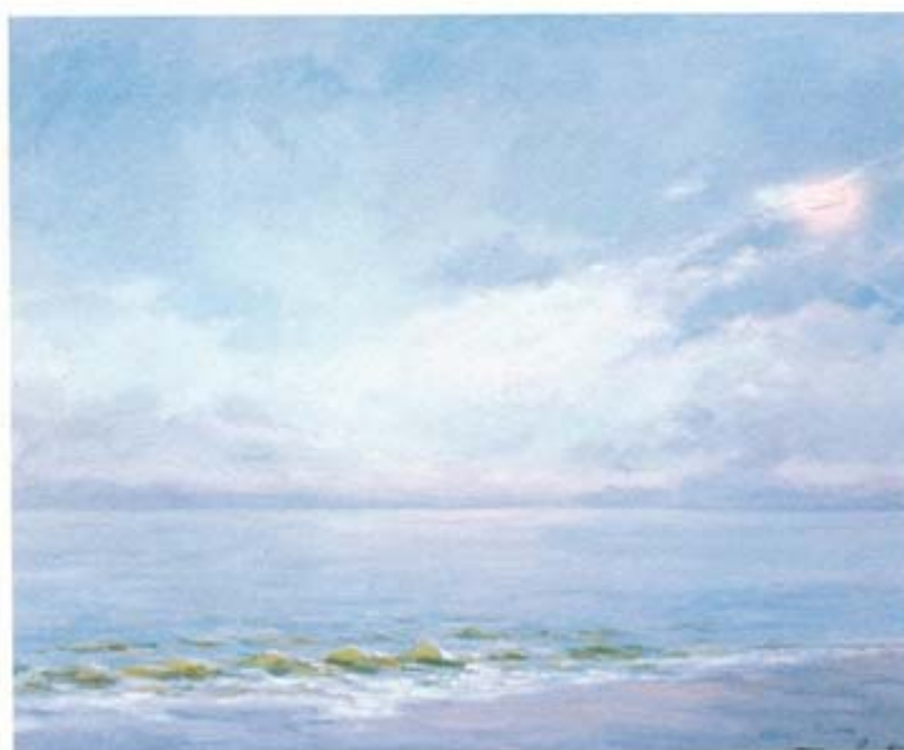
"Cambiante" óleo sobre lienzo