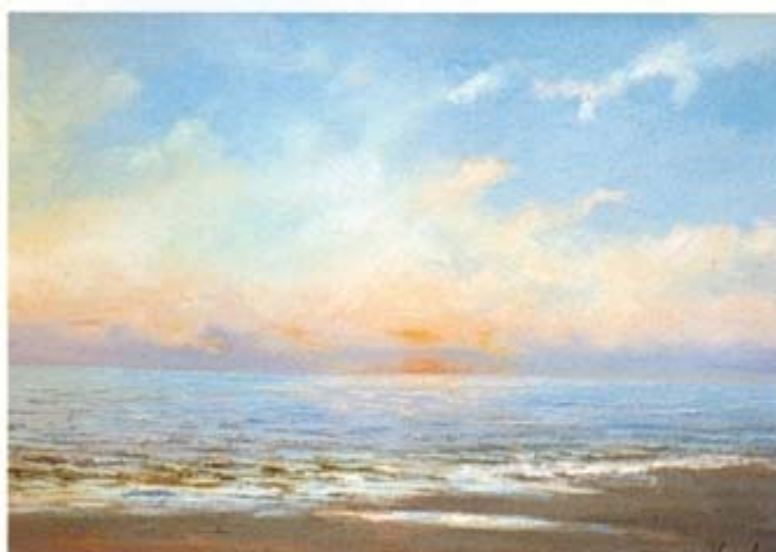
"Marina" óleo sobre lienzo