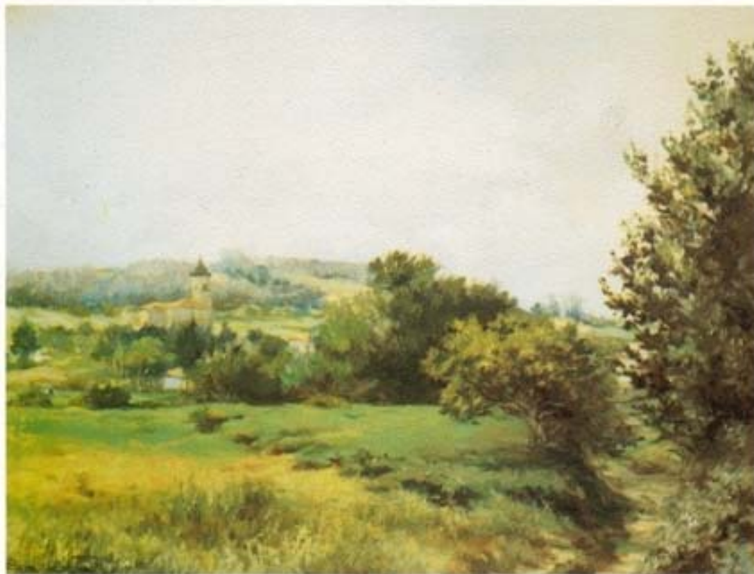
"Campos de Santander" óleo sobre lienzo