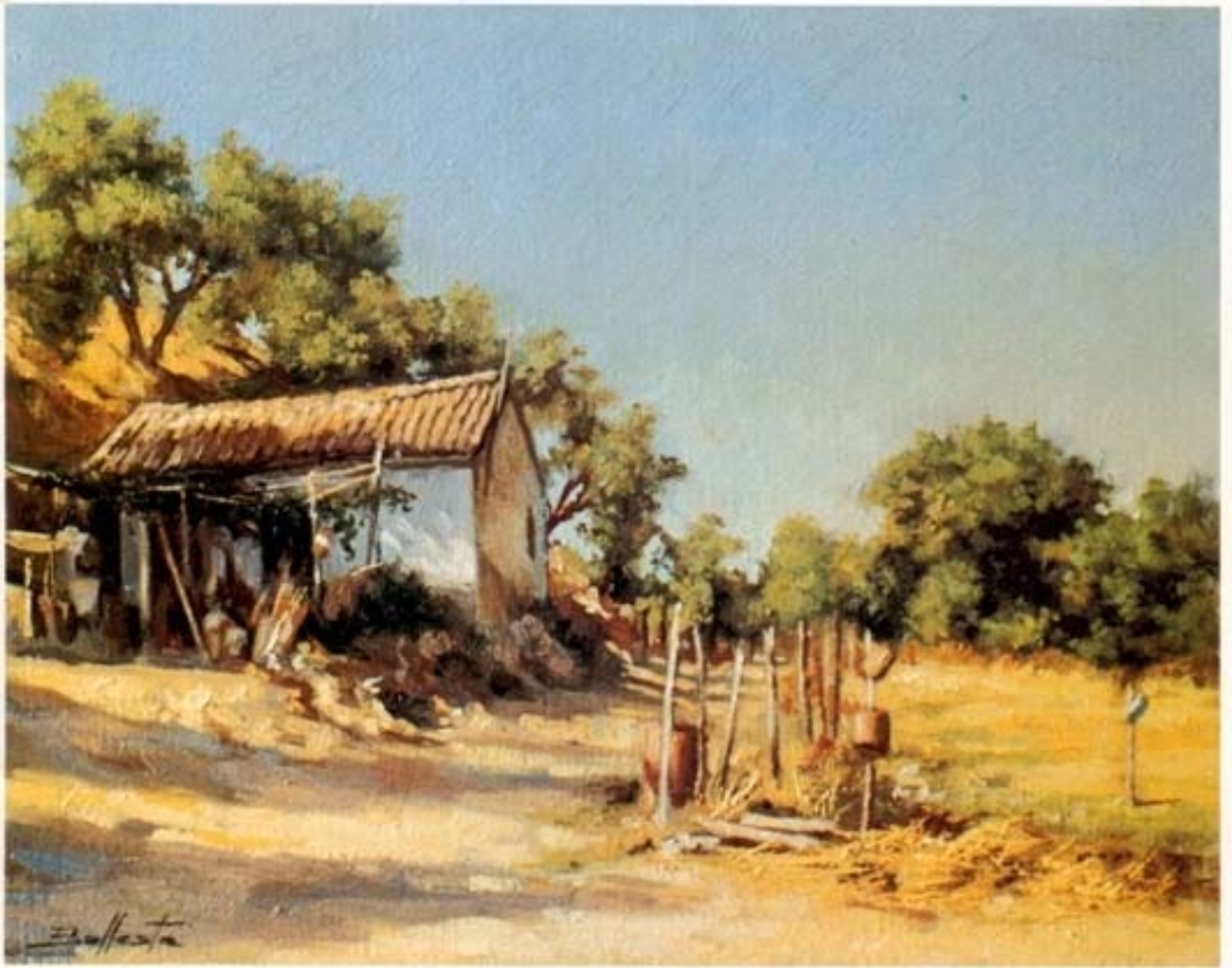
"Campo de Moguer" óleo sobre lienzo