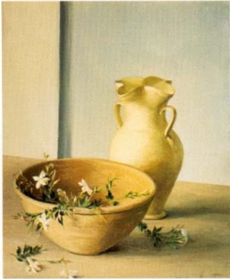
"Barro y jazmínes" óleo sobre lienzo