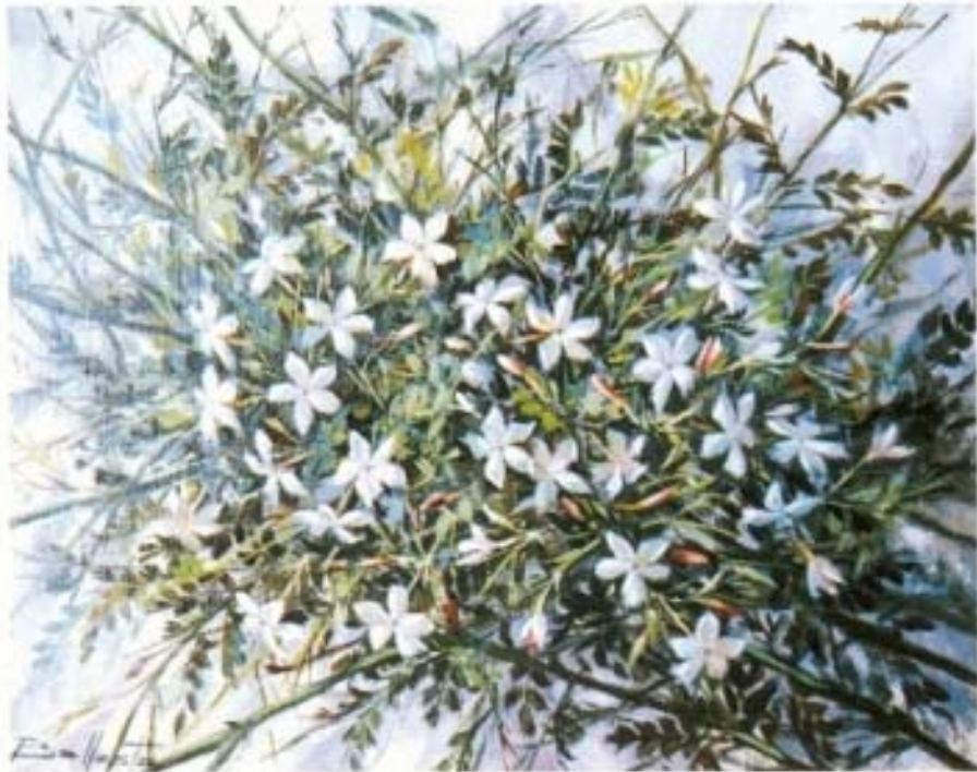
"Jazmínes" óleo sobre lienzo