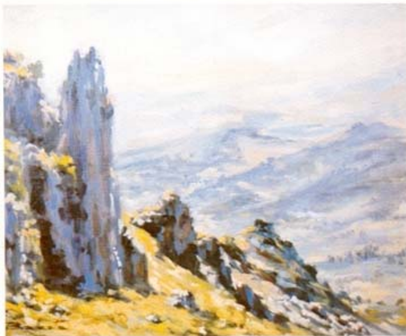
"Sierra de Grazalema" óleo sobre lienzo