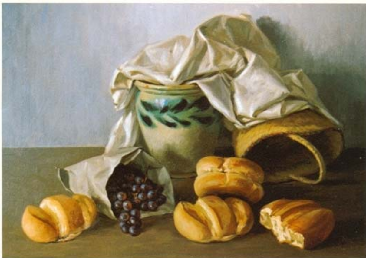
"uva y pan" óleo sobre lienzo