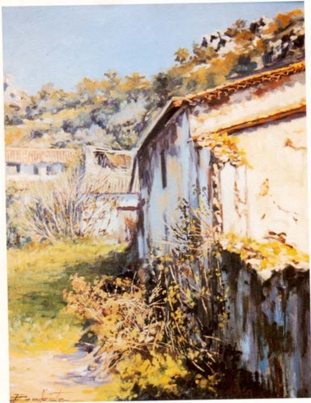
"Casas viejas de Grazalema" óleo sobre lienzo